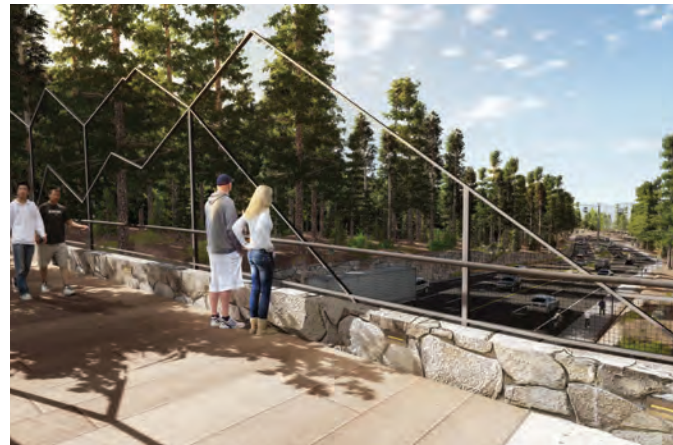
Dibujo Conceptual: pasarela para los peatones