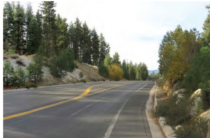
Foto: pista actual de Lake Parkway