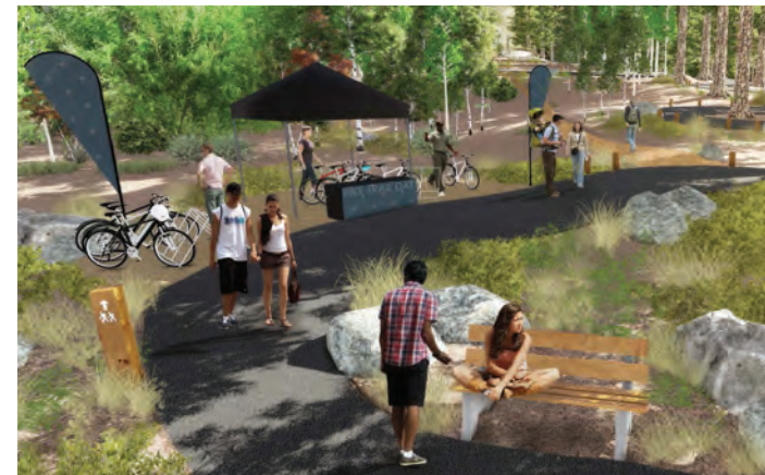
Dibujo Conceptual: propuesta del camino del peatrin