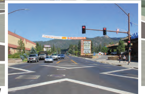
Foto: centro comercial actual