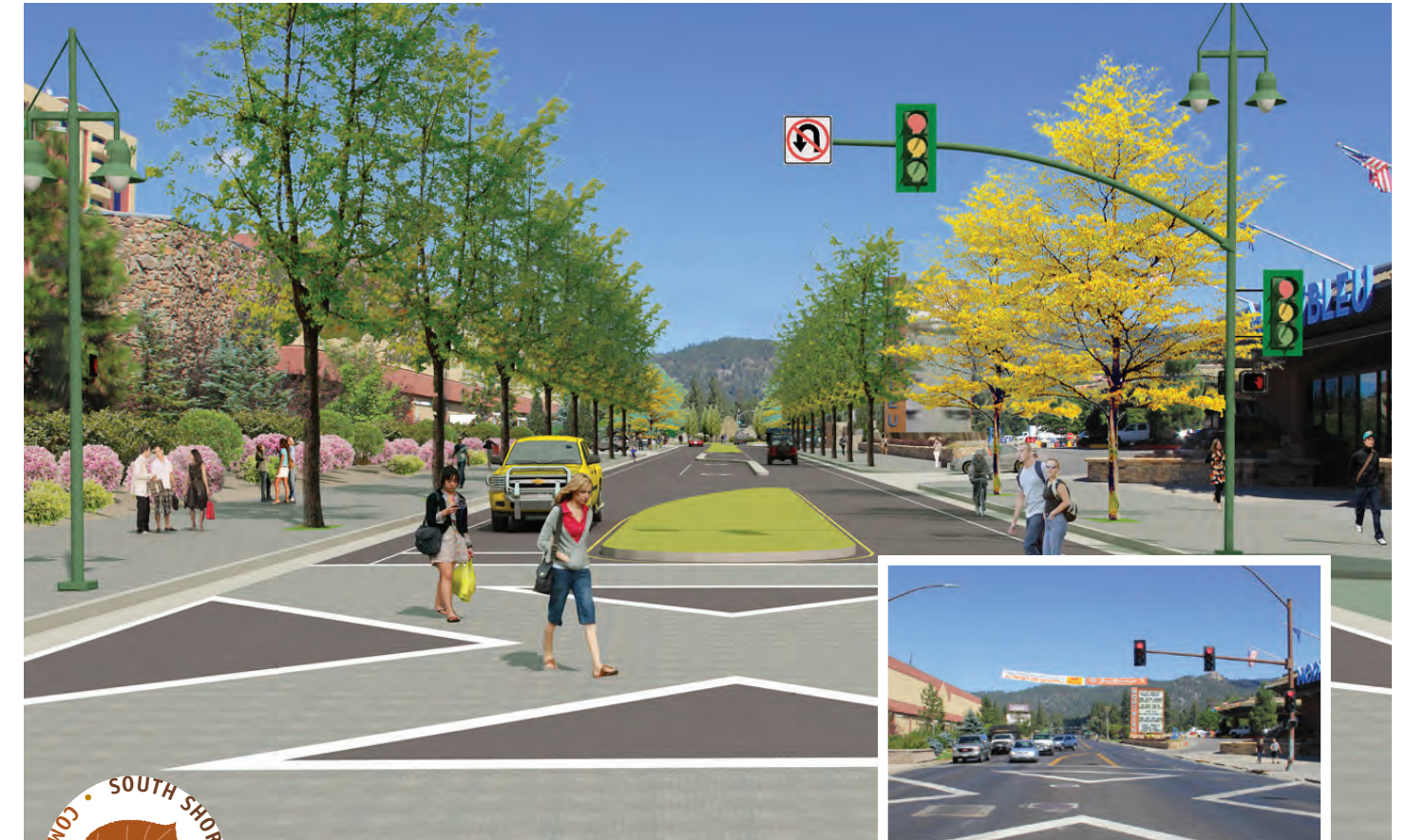
Dibujo Conceptual: propuesta del centro comercial