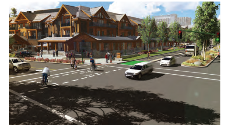
Dibujo Conceptual: propuesta de la intersección de Main Street