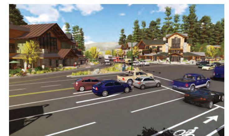
Dibujo Conceptual: salida mixta de uso desarrollado