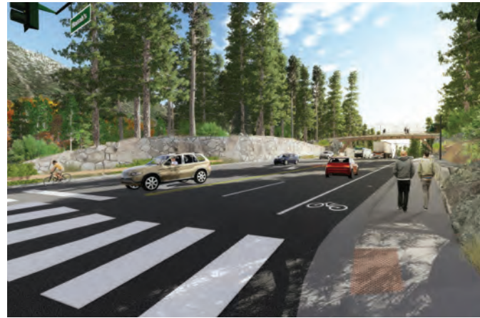
Dibujo Conceptual: entrada a US50 a Nevada

Visite al sitio TahoeTransportation.org/us50