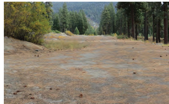
Foto: entre Bellamy y Van Sickle hoy en día